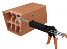
Wypełnij tuleję żywicą