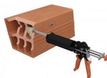
Injecter la résine.