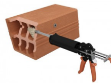
Injecter la résine.