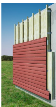
Mise en place d'un pare-pluie