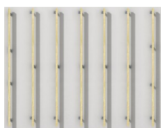
Disposition des équerres EBC