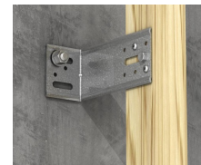
Fastgørelse af trælægte på stål