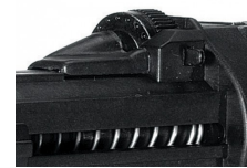
Molette de réglage de la pénétration de la tête de la vis dans le support.