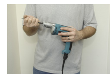
Włóż końcówkę wkręcającą.