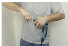
Wyjmij końcówkę wkręcającą.