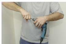
2. Verwijder dan het bit.