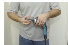
3. Monteer de adapter.