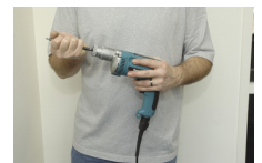
4. Steek de bithouder erin.