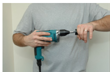
1. Verwijder de mof van uw schroefboormachine.