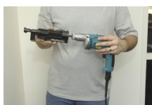
5. Bevestig de lader op de bithouder en vergrendel hem aan de adapter.