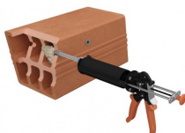
Injecter la résine.