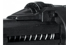
Den nemme selv-låsende dybdejustering sørger for ensartet undersænkning.