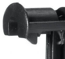
Den flade næse modvirker mærker i gipspladernes overflade.