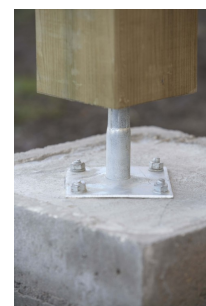
Fixation d'un pied de poteau