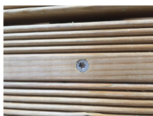
4. 8 freesribben onder kop voor een perfecte afwerking