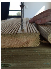
2. Débourage et rapidité de fixation