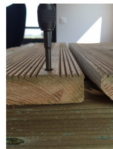
3. Plaquage de la lame sur la lambourde