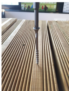
1. Meilleure pénétration, pointe effilée.